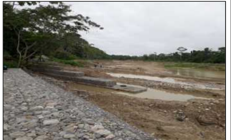
15/06/2021.- Inspección al proyecto construcción de muros defensivos en el río Ivirgarzama del Distrito-VI, con el fin de evitar pérdidas por desastres naturales y resguardar la planta de tratamiento de aguas residuales.