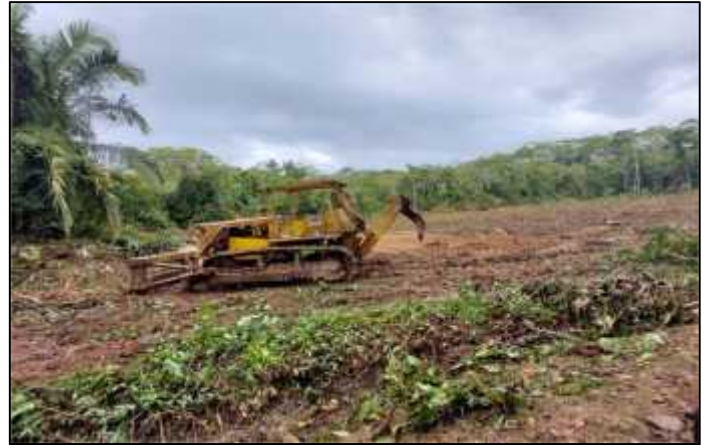
27/07/2021.- Inspección al sindicato chasqui para la delimitación y limpieza del predio para el moderno matadero municipal, conjuntamente con los topógrafos del Municipio.