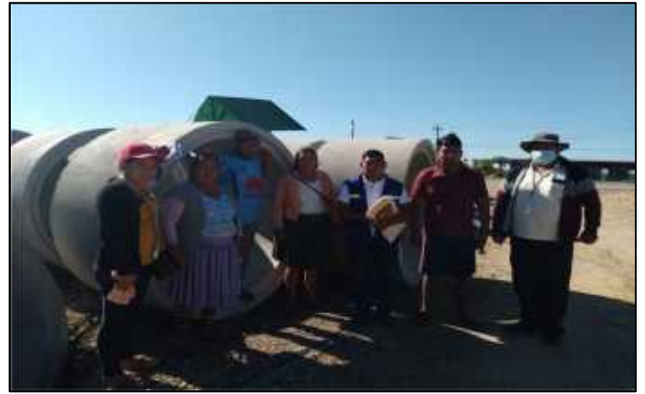
25/06/2021.- Se realizó entrega de recepción de provisión de 12 tubos de H°A D=1000MM para la construcción de Alcantarillado en el Distrito VI.