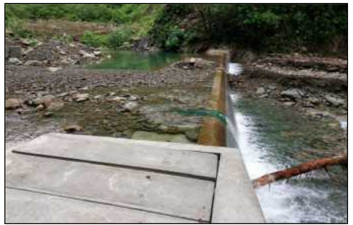
19/05/2021.- Inspección a la obra en construcción de la galería filtrante para la captación mayor del agua, en la toma de agua Puerto Rico.