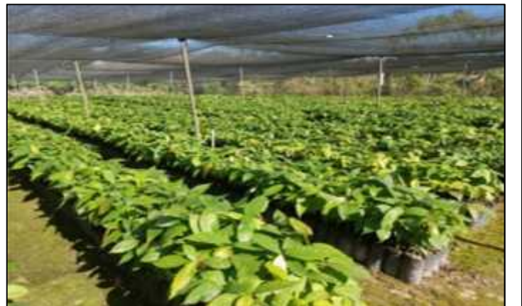
16/06/2021.- Inspección al vivero municipal en el cual pudimos observar que se encuentra en un buen estado.