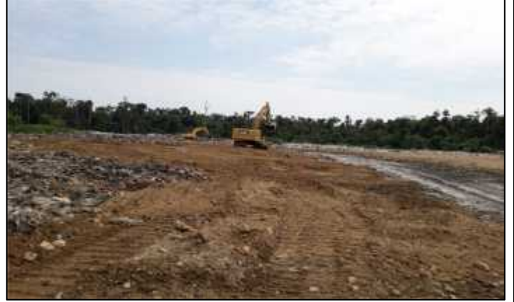
28/05/2021-08/12/2021.- Inspección al botadero municipal que posteriormente fue rellenado con material agregado con el fin de evitar la contaminación ambiental y la afectación a la salud pública.