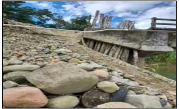
28/05/2021.- Inspección al puente vehicular del rio leche Central Morales, donde se observó que el puente vehicular necesita muros para su fortalecimiento.