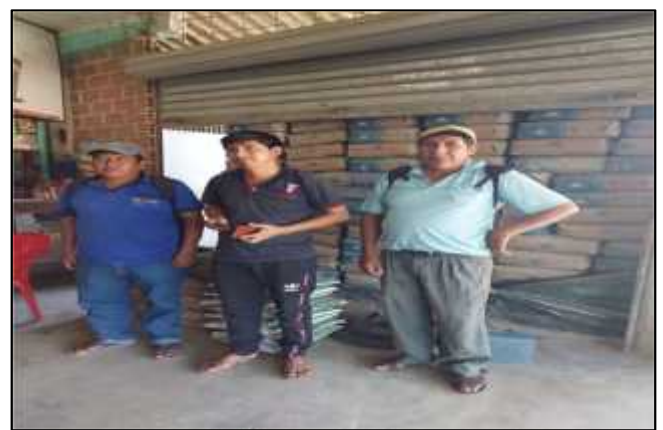
29/06/202.- Se realizó entrega de recepción de provisión de 80 bolsas de cemento para la construcción de cabezales sindicato nueva américa.